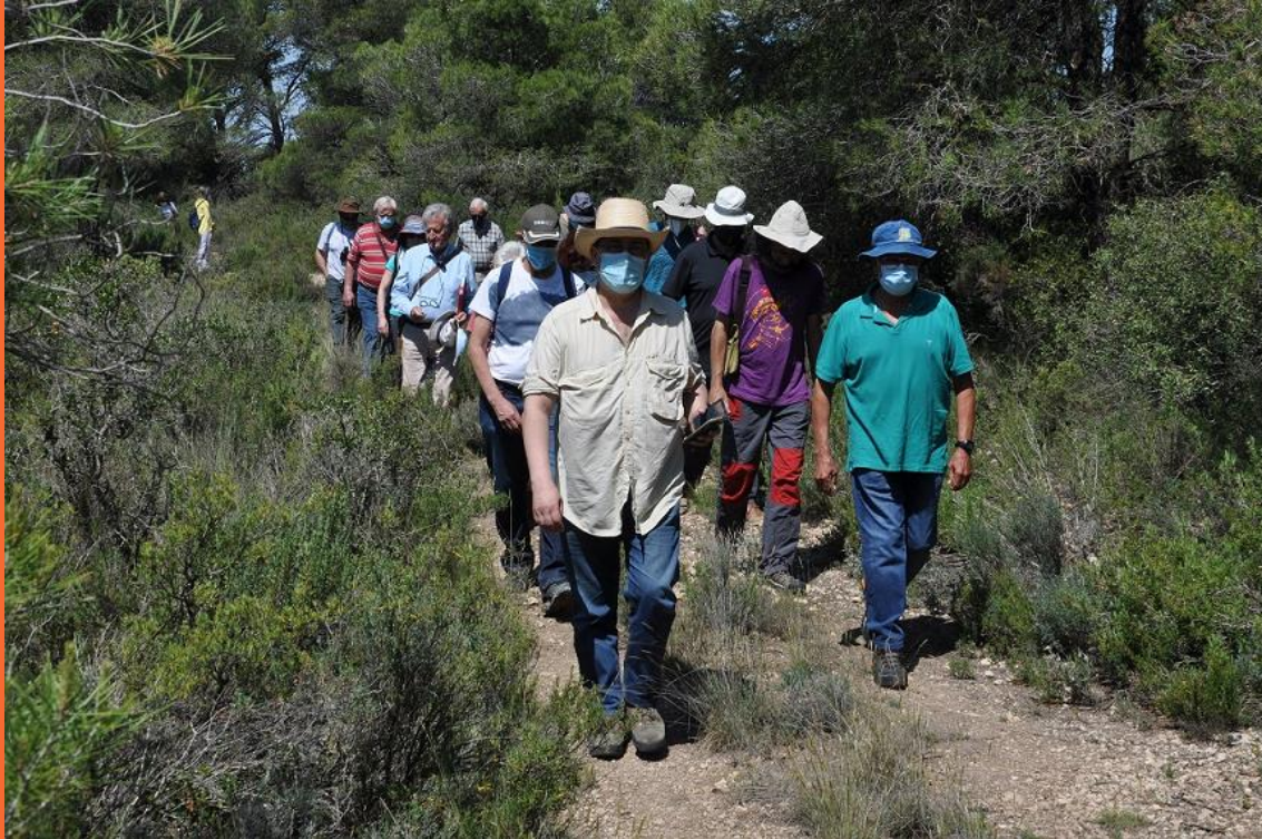
Caminando en Monte Oscuro, Día Orwell Aragón 2021.